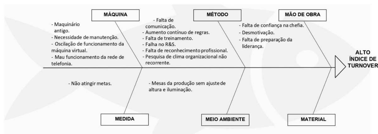
FIGURA 1 – CAUSAS IDENTIFICADAS NA ORGANIZAÇÃO

As causas apresentadas na Figura 1, foram levantadas através das informações apresentadas pela empresa, referente ao cotidiano e aos processos que os colaboradores realizam durante a execução do trabalho diário, além das conversas com outros colaboradores de alguns setores que trabalham há bastante tempo na organização. As causas foram divididas em 5 categorias, dentre as 6 ofertadas pelo diagrama de causa e efeito, não sendo utilizado o M referente ao Material, pois não foi encontrado causa que se encaixesse neste item. Totalizaram 15 (quinze) causas que levam ao problema.