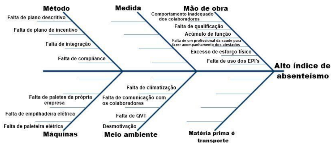
FIGURA 1 - DIAGRAMA DE CAUSA E EFEITO DA ORGANIZAÇÃO

Em visita acadêmica realizada em setembro de 2019 e com a entrevista informal feita com a gerente de RH, além da observação não participativa, identificou-se que há um alto índice de absenteísmo na empresa. A partir desta constatação, realizou-se um brainstorming para identificar as principais causas que estão contribuindo para a ocorrência do problema conforme a Figura 1 demonstra.