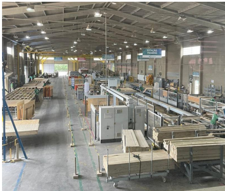
Figura 4. Fábrica Tecverde em Araucária/PR.