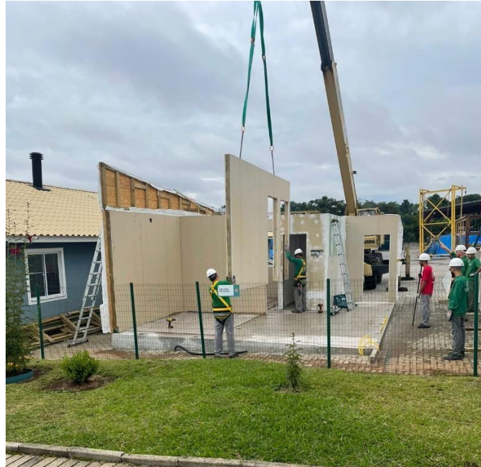
Figura 2. Montagem de parede com utilização de guindaste.