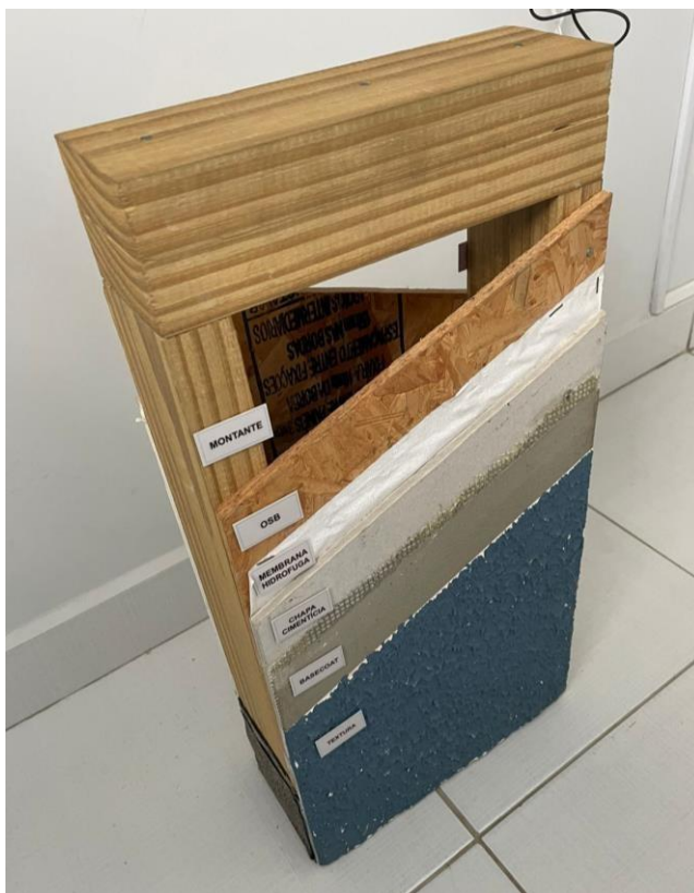
Figura 3. Composição da estrutura de wood frame.