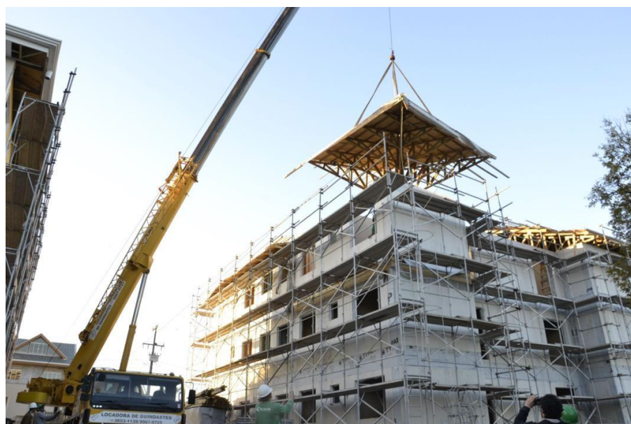
Figura 1. Finalização da montagem do primeiro edifício em wood frame no Brasil.

Apenas em 2016 foi concluída a primeira construção utilizando o método wood frame no Brasil. Edificação multifamiliar de três pavimentos, com 12 apartamentos, em Araucária/PR, região metropolitana de Curitiba, realizado pela construtora Tecverde Engenharia.