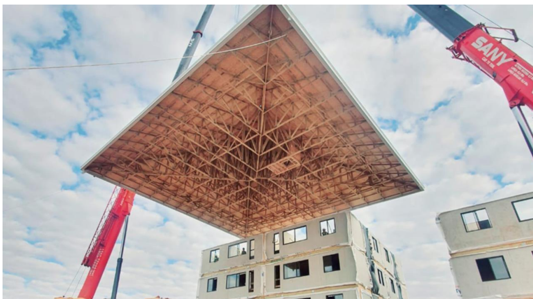
Figura 5. Instalação de telhado com utilização de guindaste.

Em edificações unifamiliares (casas térreas e sobrados) o telhado em telhas cerâmicas com 20mm de espessura é aplicado sobre ripamento sendo o beiral de 600mm de projeção horizontal. Nas unidades geminadas, os septos (oitões internos) localizados acima das paredes de geminação simples, são independentes e compostos por estrutura metálica ou em madeira contraplacada com uma camada de chapas de gesso para drywall do tipo “Standard” de 12,5mm de espessura. Para as unidades com parede de geminação dupla, os septos (oitões) são compostos pela própria parede de geminação dupla, os quais ultrapassam o telhado e são protegidos em seu topo por rufos metálicos galvanizados. Ao sistema de cobertura é aplicado forro em gesso ou em réguas de PVC, sobreposto por manta de lã de vidro com 89mm de espessura e condutividade térmica da ordem de 0,049W/mK.