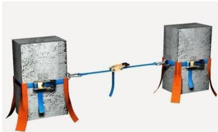
Figura 1: Linha de Vida horizontal temporária

A Figura 1 mostra um exemplo de corda de segurança horizontal temporária.