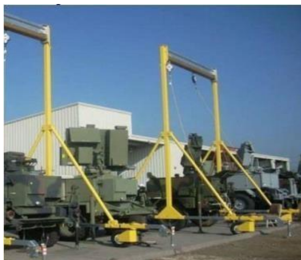
Figura 2: Linha de vida horizontal móvel

As linhas horizontais móveis podem ser montadas, desmontadas ou movimentadas de seu ponto de utilização, são usadas principalmente para manutenção e instalação de sistemas tubulares e máquinas. É composta por perfis tubulares de aço, cantoneiras e peças metálicas (CLIMBING SERVICE, 2018).