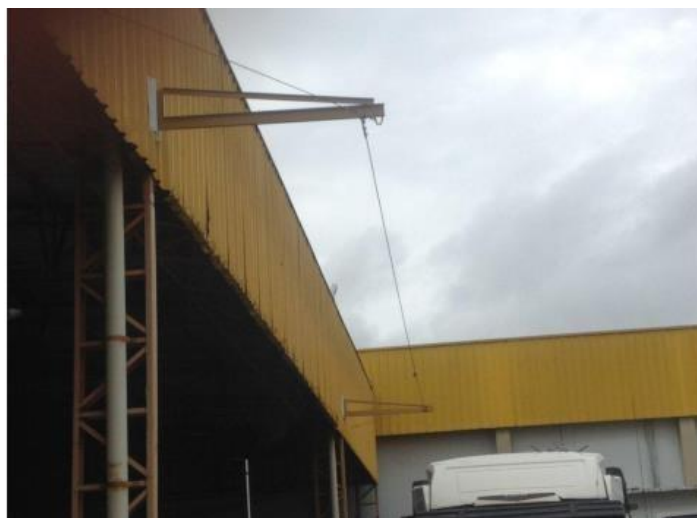
Figura 3: Linha de vida horizontal fixa

Existem também linhas de vida horizontais fixas, que são usadas principalmente em locais como telhados, galpões e silos. A linha horizontal fixa é geralmente composta por cabos de aço, trilhos de metal e pontos de ancoragem (apenas nas extremidades ou no meio). Este tipo de linha pode suportar vários operadores ao mesmo tempo, como o próprio nome indica, é permanente e não móvel (FREITAS, 2021).