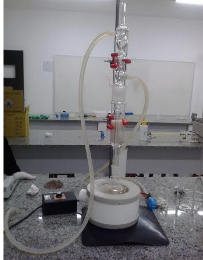
Figura 2 - Extrator Soxhlet