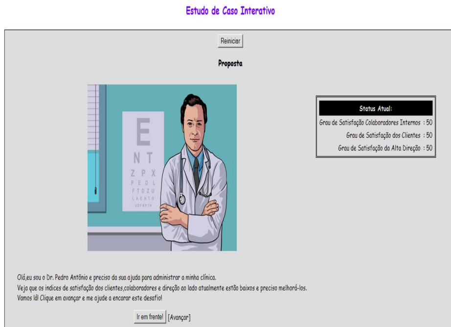
FIGURA 2 TELA INICIAL DO ESTUDO DE CASO INTERATIVO CONSTRUÍDO