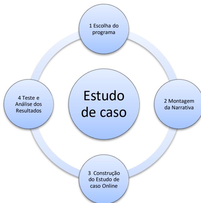
FIGURA 1 ROTEIRO DA EXECUÇÃO DO TRABALHO

Na figura 1 ilustramos o processo de estruturação do trabalho realizado.