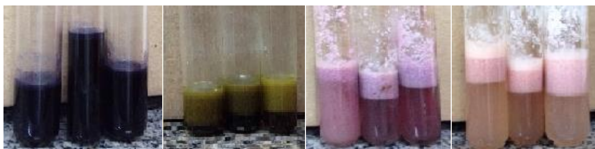
Método A- Positivo