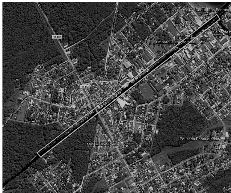
FIGURA 1: CANAL COM 2,0 KM DE COMPRIMENTO E 22 M DE LARGURA MÉDIA.